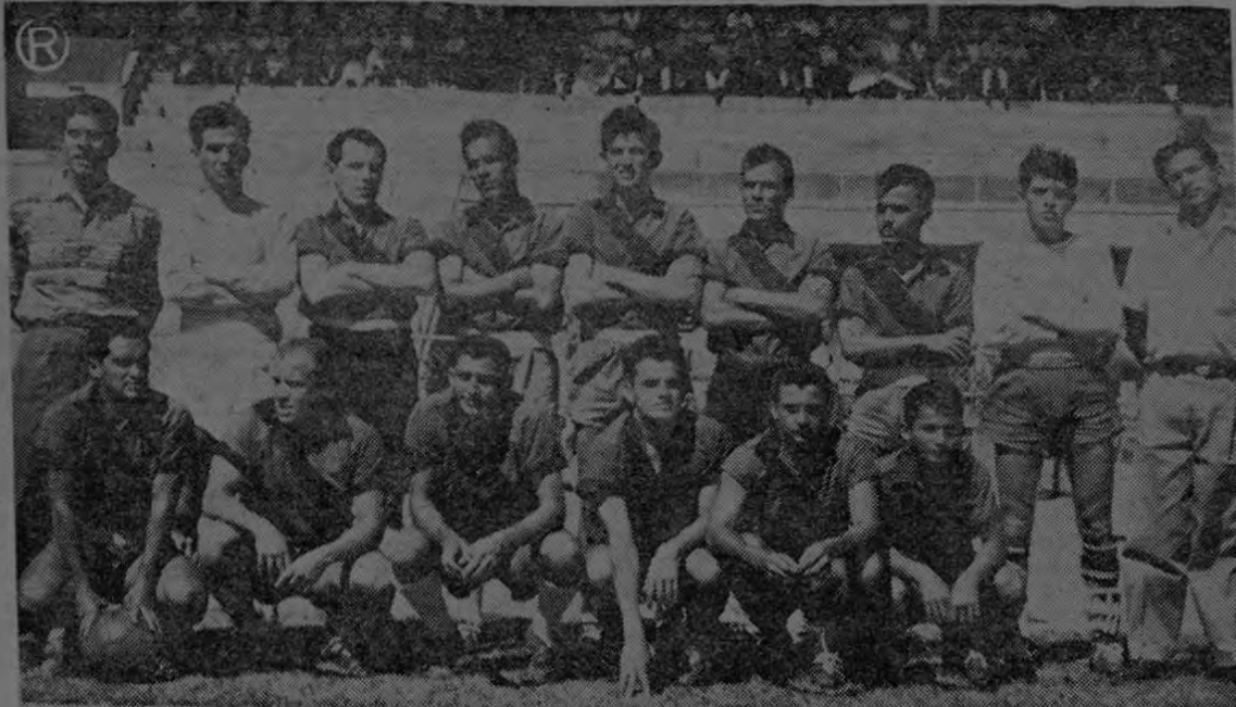
Este es el conjunto de Gobernación y Policía que obtuvo ayer el título de Campeón Relámpago 1959, INTERMINISTERIAL. Como se ve está constituido por elementos fogueados, que han participado en primeras divisiones y que forman un equipo parejo que dará muchos espectáculos y pelea en el campeonato abierto que se inicia el próximo sábado.