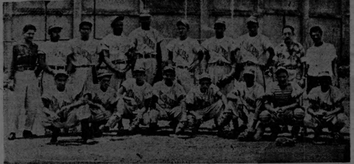
Sigue su racha de triunfos la novena mantequillera. Ayer dió uno de los más importantes pasos hacia la conquista del gallardete del beisbol capitalino. Al derrotar al Gigantes no sólo se hizo un valioso punto sino que se lo arrebató a su más cercano rival lo que en realidad viene a ser doble triunfo.