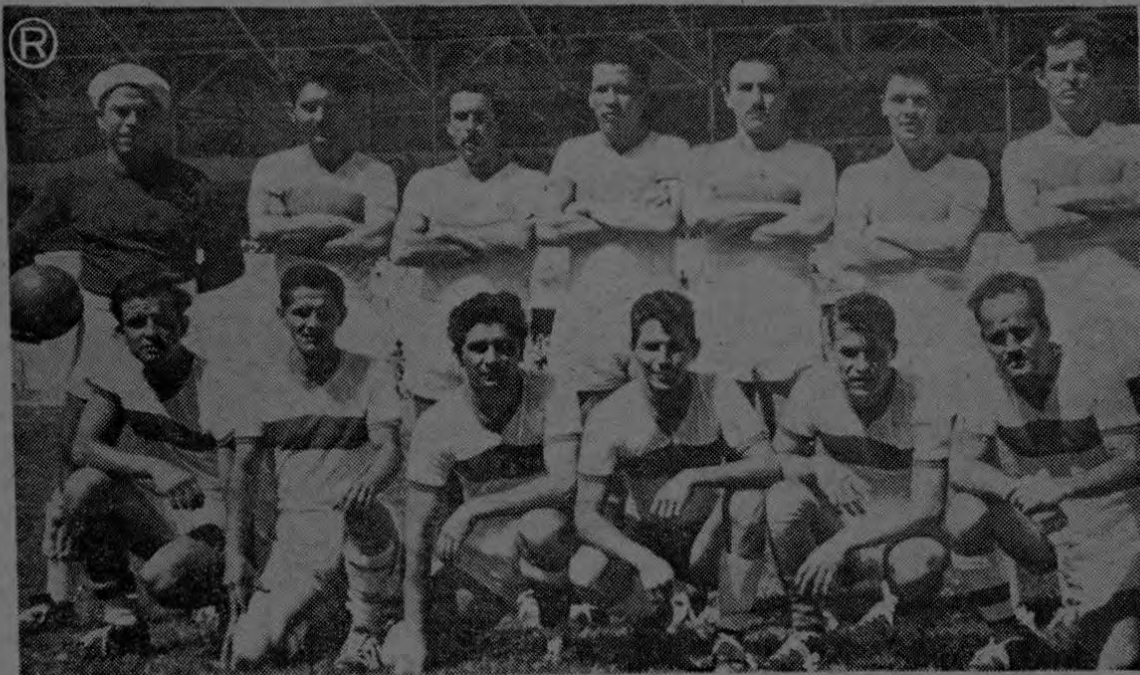
He aquí a Agricultura e Industrias, que ayer llegó a la final con el Ministerio de Gobernación perdiendo por dos corners contra uno. Tienen bastantes recursos, jugadores expertos. Fueron digno contrincante del Campeón y se perfilan como uno de los trabucos.